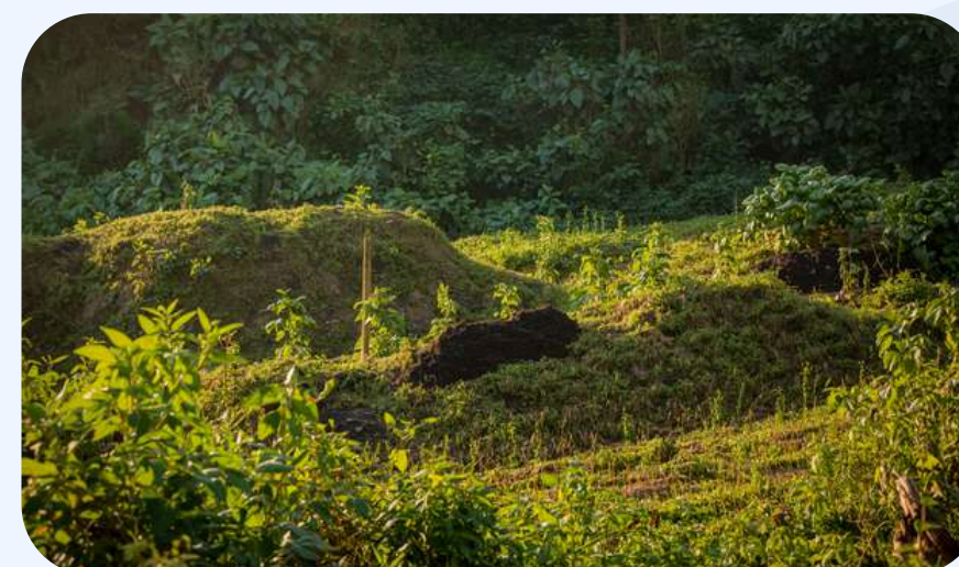
Buenas prácticas ambientales