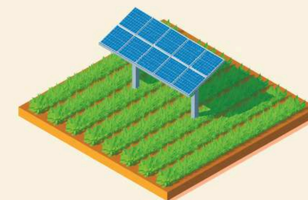
Cultivos y Estructuras Solares