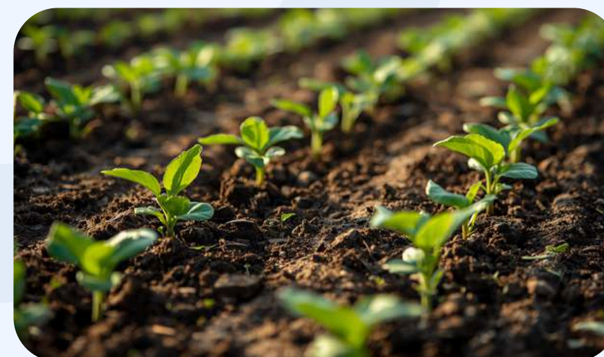
Gestión del suelo y riego

Los siguientes ejes complementan la formación técnica con competencias en gestión sostenible del territorio, monitorización de sistemas agrivoltaicos, responsabilidad ambiental e igualdad de oportunidades. Una formación integral para el empleo verde del futuro.