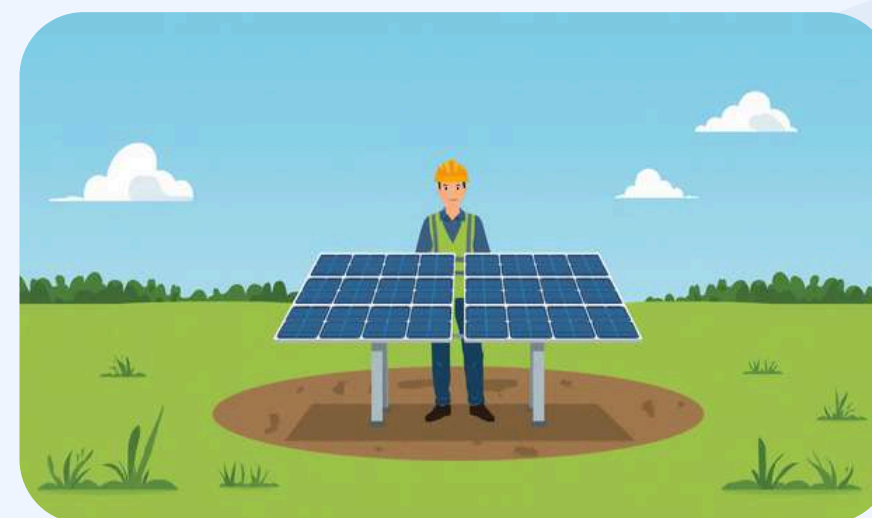
Operación y Seguridad