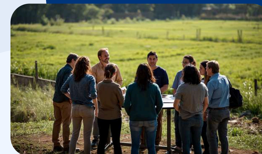
Igualdad y habilidades blandas