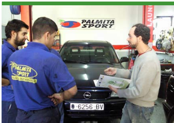
Asesoramiento en talleres de reparación de automóviles

En el caso del sector de talleres de reparación de automóviles, con residuos altamente contaminantes, gracias a esta información, han podido mejorar su política ambiental.