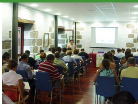
Curso en industria alimentaria y Curso en comercio