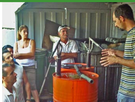
Curso en cementera y Curso en empresa de yesos