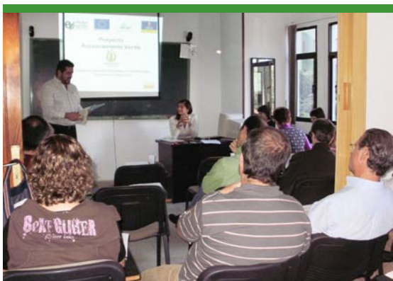
Asesoramiento a empresarios del turismo rural.