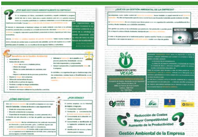
Anverso y reverso del folleto Asesoramiento Verde